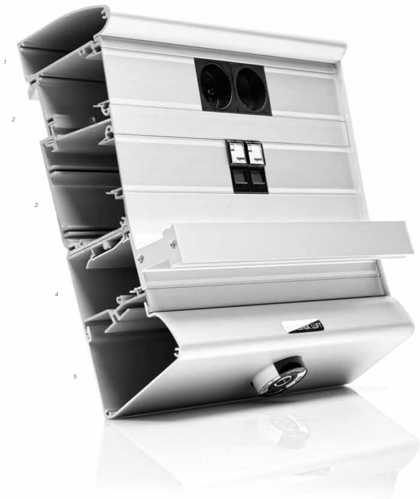
1 - Afrundet hylde - evt. indbygget lys