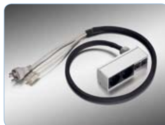
Kompakt panel PDCR