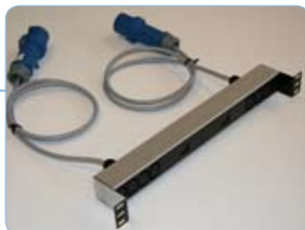
Dobbelt Amperemeter panel