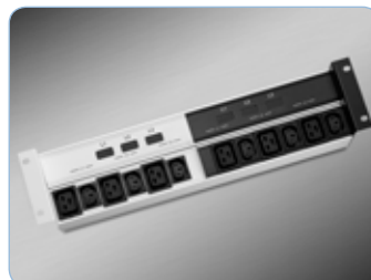
2x3 faset panel