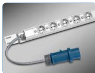
BPP - Blade Power Panel