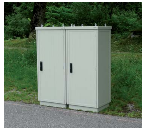
Anreihbarkeit einer zweiten Doppelwandkabine